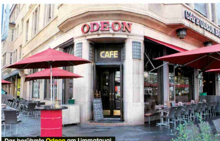
Das berühmte Odeon am Limmatquai